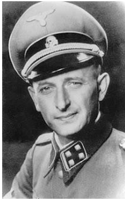
Tisztafajú Árja. Közel-Keleti Típus...

önkéntes Palesztinába vándorlásra kell ösztönözni. Miután túltették magukat a meglepetésen, amit Eichmann kirívóan szemita orra okozott, mely úgy nézett ki, mintha "a zsinagóga kulcsa meredezne az arca közepén", SS bajtársainak nemes társasága csak ennyit mondhatott: "Pofa be! Ez a Führer parancsa!" - és mindenkinek minden egyértelmű volt, mert a Führernek mindig igaza volt. Eichmann tehát fel volt készítve, hogy megkezdhesse munkáját berlini Irodájában, a munkát, melyért védőügyvédje, Servatius a hatvanas években a jeruzsálemi bíróság előtt érdemrendet követelt neki, nyilvánvalóan Eichmann áldott tetteiért, amelyek a zsidók Palesztinába települését eredményezték.